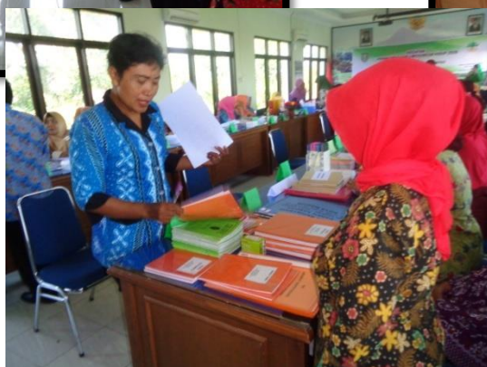
Lomba administrasi Pada kegiatan peringatan hari lingkungan hidup