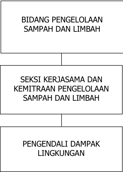
Tabel 1.1. Struktur Organisasi Seksi Kerjasama dan Kemitraan Pengelolaan Sampah dan Limbah